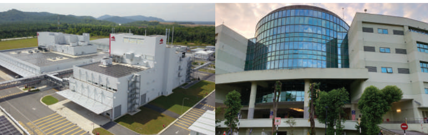
Kilang di Bandar Enstek, Negeri Sembilan | Pejabat Utama di Technology Park Malaysia, Kuala Lumpur