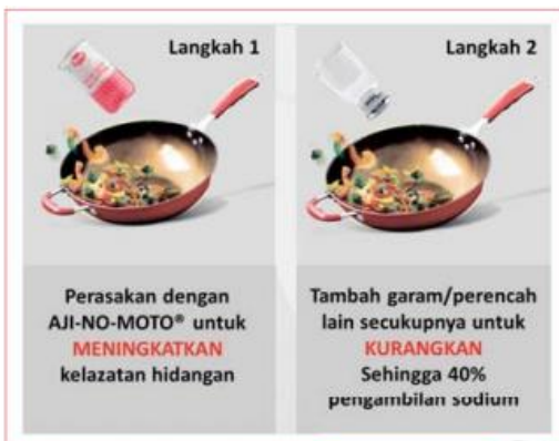
Dua langkah mudah dalam penyediaan hidangan lazat yang rendah sodium/garam.

Untuk maklumat lebih lanjut mengenai resipi rendah garam, sila layari laman web AMB di www.ajinomoto.com.my/golden-age-group-reduced-sodium-diet-recipes atau laman Facebook Ajinomoto Malaysia dan Hi Ajinomoto MY.